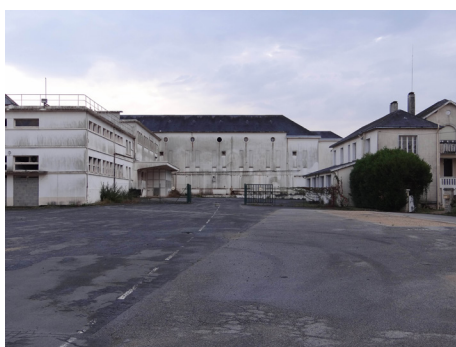
[6] L'ancienne laiterie