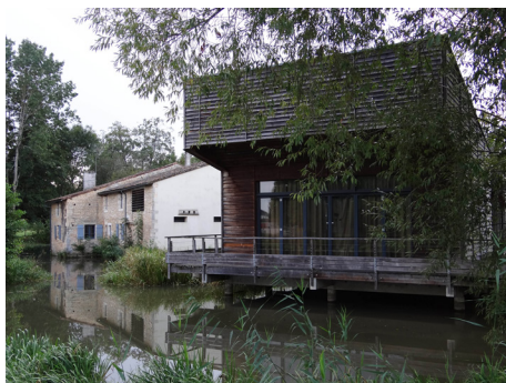
[10] Le Moulin du Marais