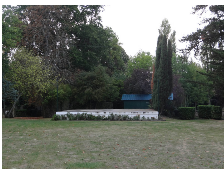
[11] La scène du Parc Honoré Canon