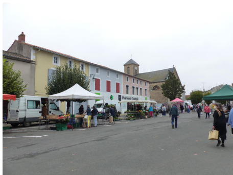
[4] La Grande place et l'Église